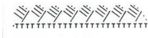
Рисунок 3 – Схема вязания кружева