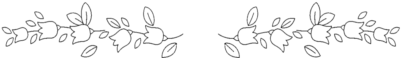
Рисунок 3 – Схема вышивки