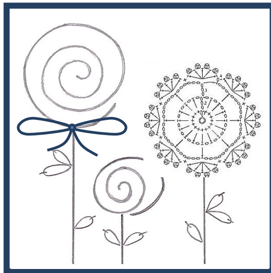
Рисунок 1 – Эскиз игольницы «Карамелька»

Детали игольницы соедините швом «строчка» шириной 1 см, предусмотрев отверстие для выворачивания. Через отверстие для выворачивания наполните подушечку полиэфировым наполнителем. Открытый участок зашейте потайными стежками.