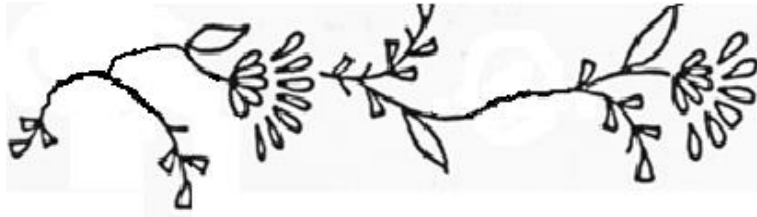
Рисунок 2- вышивка.